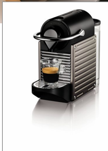
NESPRESSO PIXIE Machine à café Nespresso XN3005CH